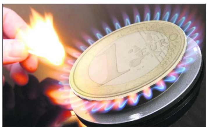
Netzkosten machen rund ein Fünftel des Gasendpreises für Haushaltskunden aus.

Bonn – Gute Nachricht für Gasverbraucher: Die großen Netzbetreiber müssen die Gebühren für den Zugang zu ihren Netzen um im Schnitt bis zu 25 Prozent senken. Das verfügte die Bundesnetzagentur mit Wirkung zum 1. Oktober, wie die Behörde gestern in Bonn mitteilte. Die erstmals für die zehn überregionalen Ferngasnetzbetreiber genehmigten Durchleitungsentgelte sollen für mehr Wettbewerb sorgen. Kürzungen bei den Netzgebühren wirken sich indirekt auch in niedrigeren Preisen für die Endkunden aus. Nach Angaben der Stadtwerke Kiel jedoch wird die Gebührensenkung die Gaskunden nur geringfügig entlasten. Aktuell zeige sich, dass der Wettbewerb auf dem Gas-